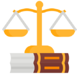
Lois et droits